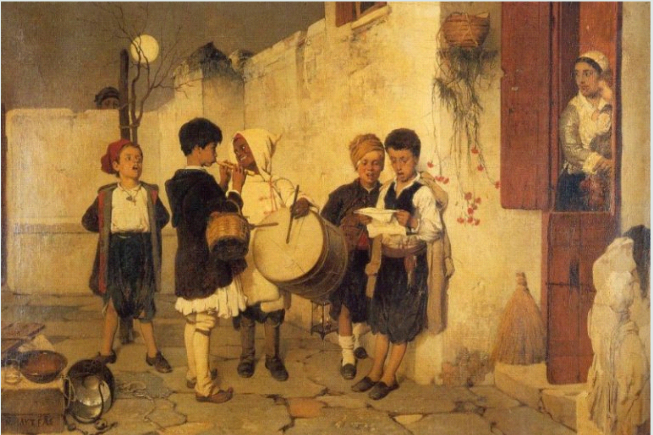
Κάλαντα (1872), Νικηφόρος Λύτρας(1832-1904)

Τρανός ή Πρωτάρης ή Μεγάλος μήνας ή Μεγαλομηνάς, γιατί είναι ο πρώτος μήνας του έτους με 31 μέρες.