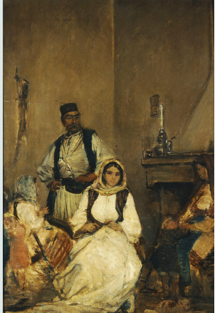
Οικογένεια στο τζάκι, Νικόλαος Ξυδιάς(1828-1909), Συλλογή Ιδρύματος Ε. Κουτλίδη

Την 1η ημέρα του Ιανουαρίου γίνεται το ποδαρικό της Πρωτοχρονιάς. Σύμφωνα με την παράδοσή μας, εκείνη την ημέρα, προσέχουμε να συναντήσουμε ή να δεχτούμε στο σπίτι μας πρώτο-πρώτο το πρόσωπο που θα μας φέρει καλοτυχία. Σε μερικούς τόπους, το ποδαρικό το κάνει ο ίδιος ο νοικοκύρης ή ο πρωτότοκος γιος ή ένα τυχερό παιδί, για να εξασφαλιστεί η καλοχρονιά. Η είσοδος του στο σπίτι μάλιστα συνοδεύεται με κάποιες πράξεις ή ευχές όπως το σπάσιμο του ροδιού και η ευχή και του χρόνου με υγεία.